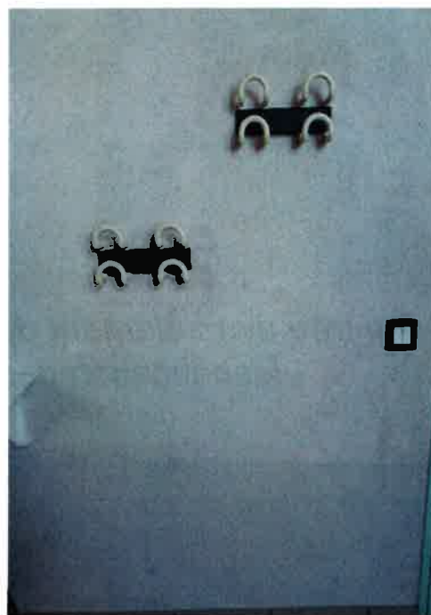
Patères a différentes hauteurs Prises électriques de couleur