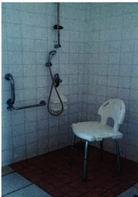
Siège de douche réglable