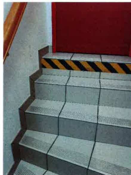
Repaire sur les marches et contraste des rampes