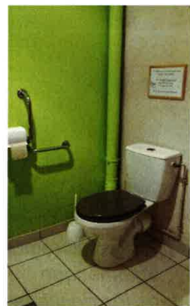
Barres d'appui prolongées – Dessus de toilettes de couleur