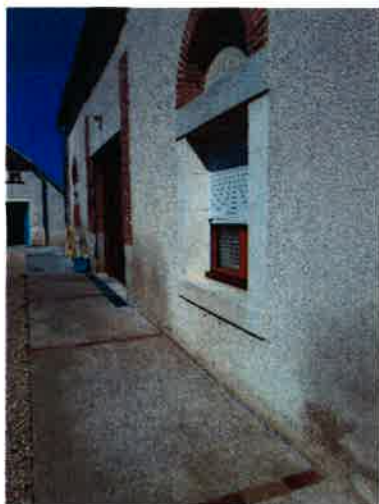
Passage pour les personnes à mobilité réduite