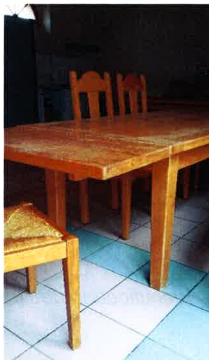
Hauteur libre sous les tables avec rallonge hauteur 70.5cm