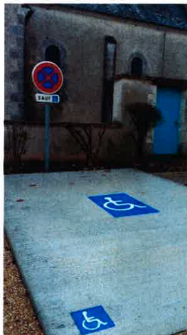
Place de parking réservée