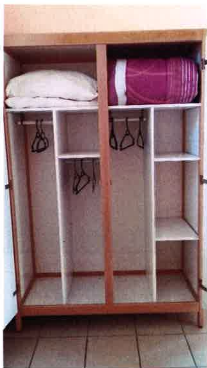
Deux hauteurs de tringle dans les armoires