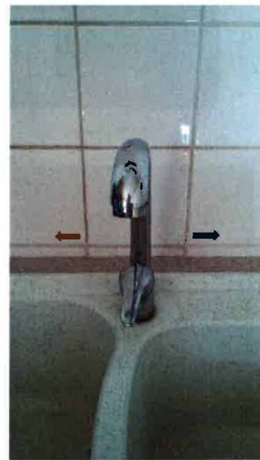
Mitigeur avec repaire chaud – froid sur les lavabos et évier