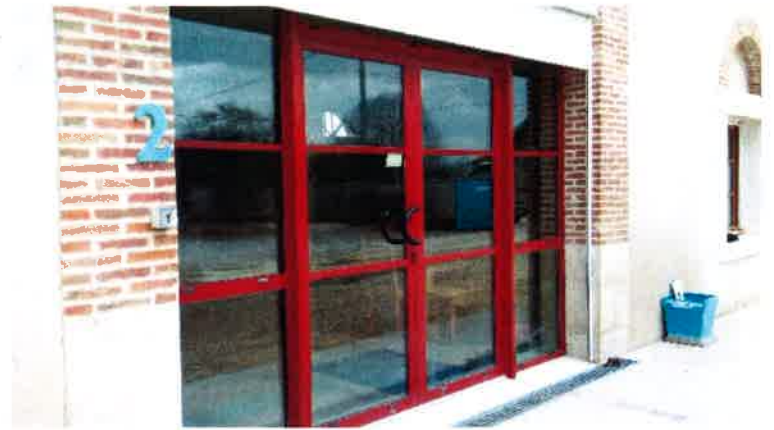
Porte d'entrée avec élément de repérage à deux hauteurs différentes et identification des bâtiments par un numéro