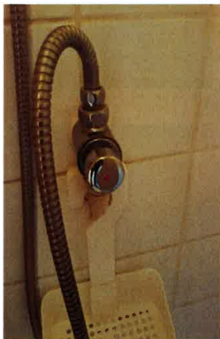
Mitigeur avec réglage automatique dans les douches