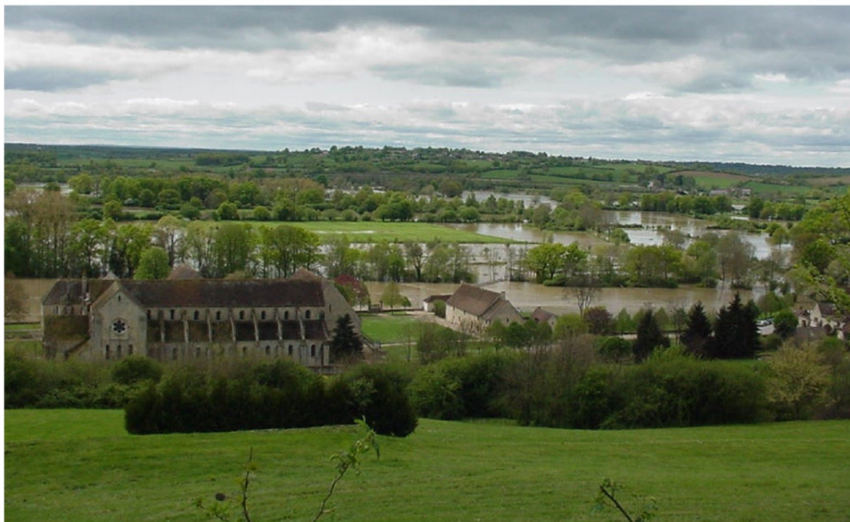
Abbaye de Noirlac - mai 2001